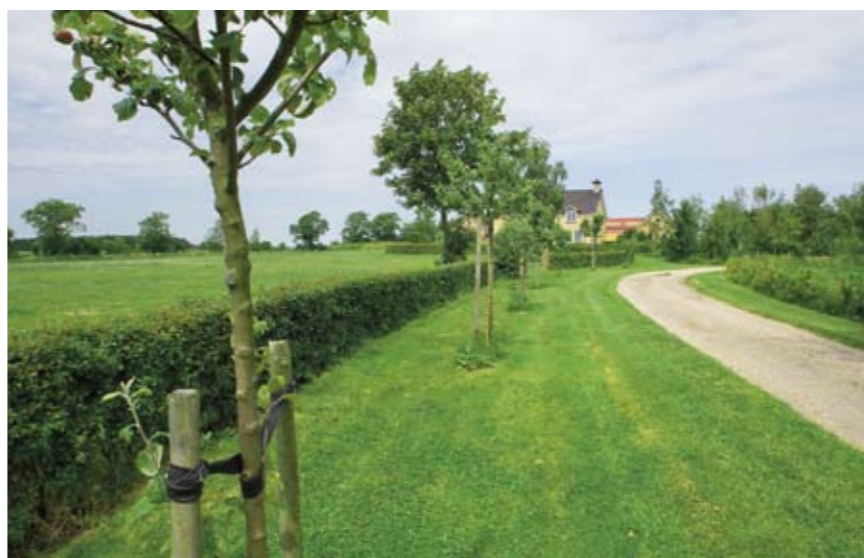
Fruitbomen verfraaien de oprijlaan.

Hoewel de focus van het project op de kleine hobbyhouder lag – daar kun je met kleine ingrepen veel resultaat behalen – hebben de twee zowel particulieren als professionele bedrijven geadviseerd hoe zij de voorzieningen voor de paarden beter en mooier in het landschap kunnen ►