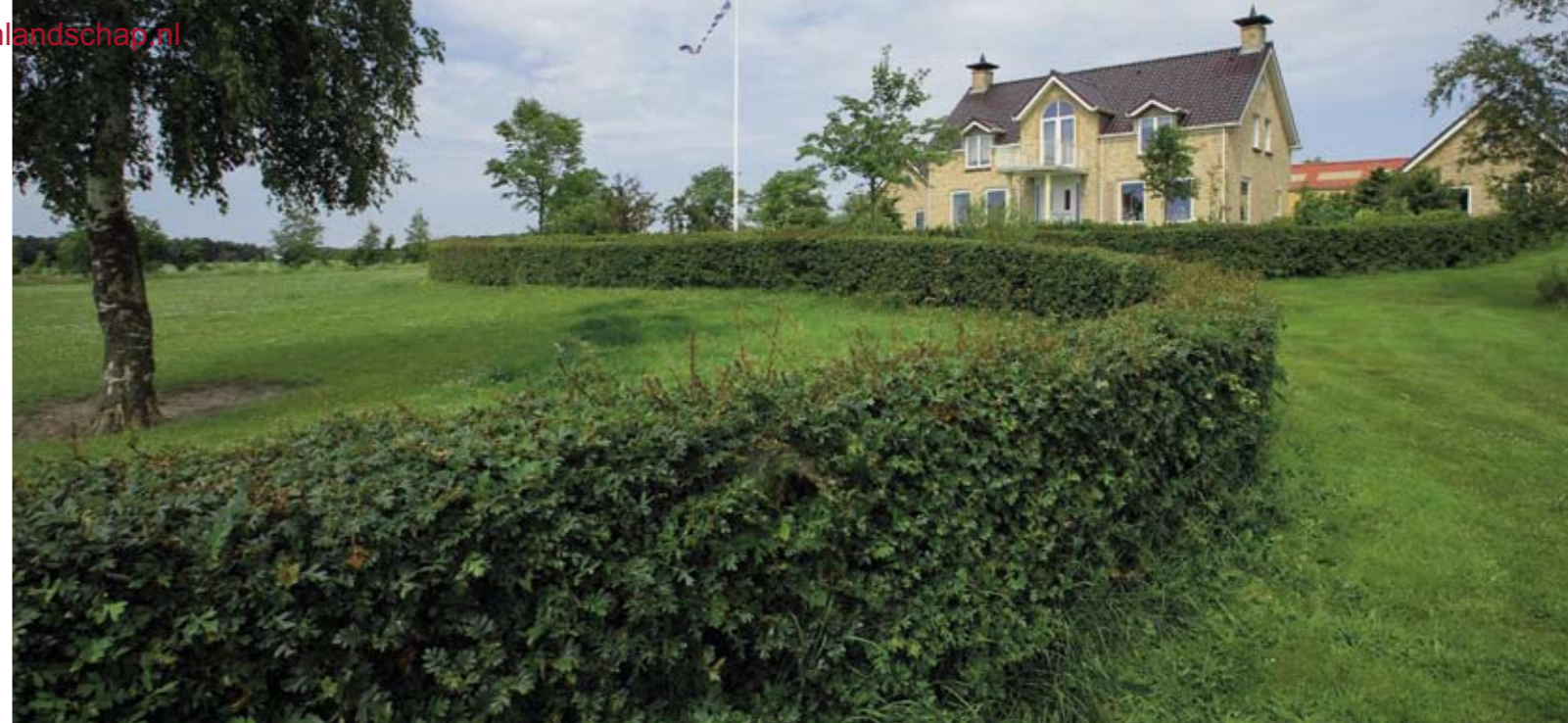
De haag van Ilex rondom de voortuin voldeed niet als afrastering van de paardenwei; de paarden aten er namelijk gaten in. Een tweede haag van Crataegus monogyna was noodzakelijk.

Tijdens de open dagen en bedrijfsbezoeken werd de adviseurs duidelijk dat het de meeste mensen aan kennis ontbreekt over de inrichting met groen en het beheer ervan. Zo trof Zevenberg