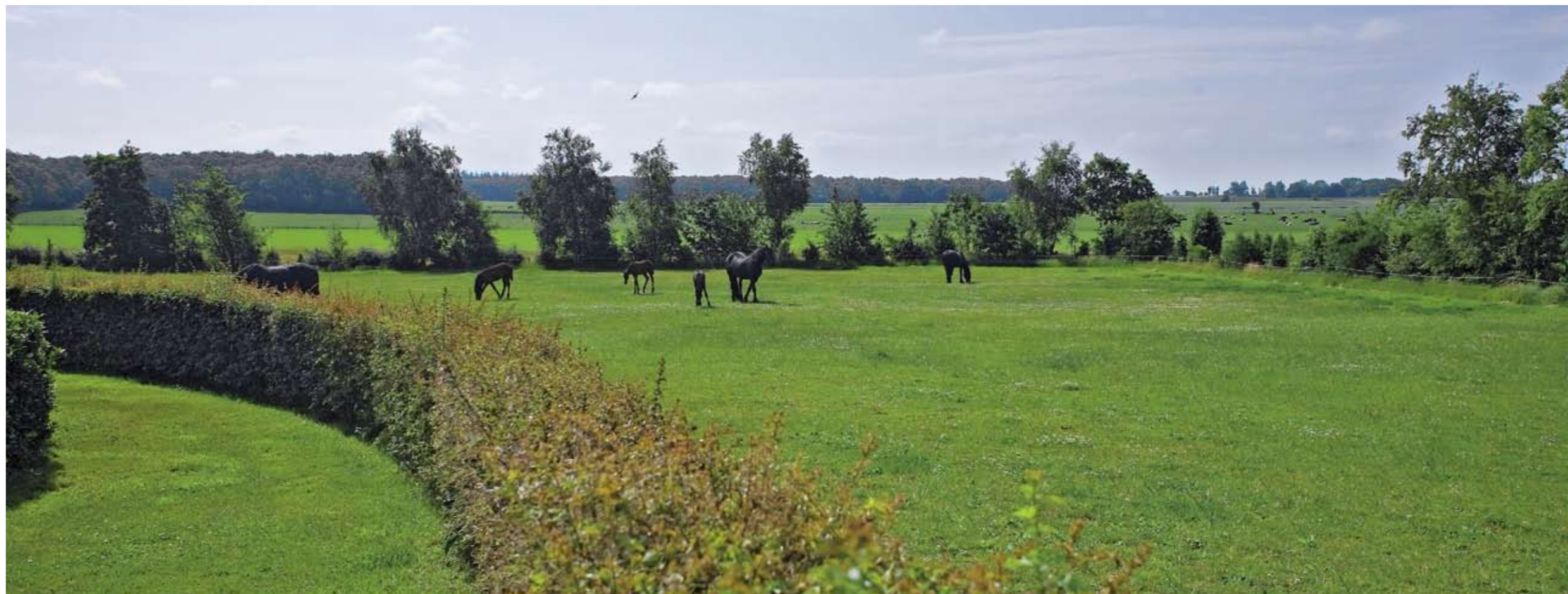
Een haag van Crataegus monogyna scheidt de paardenwei van de familie Mous van de voortuin. Een boomsingel omzoomt de rest van de weide.

Behalve de grootte van de paardenstapel zijn voor het landschap vooral ook het aantal en soort locaties waar de dieren gehouden worden van belang. Volgens Alterra waren er in 2006 zo'n 81.000 locaties, waarvan 90% de paarden hobbymatig houdt in kleine aantallen (1-5). Wat betreft het landschap is dus bij deze hobbyhouders de meeste winst te behalen. Dit is ook de redenatie van SBNL, die in 2006 in samenwerking met Landshapsbeheer Nederland en de Koninklijke Hippische Sportfederatie (KNHS) het project Zorg voor