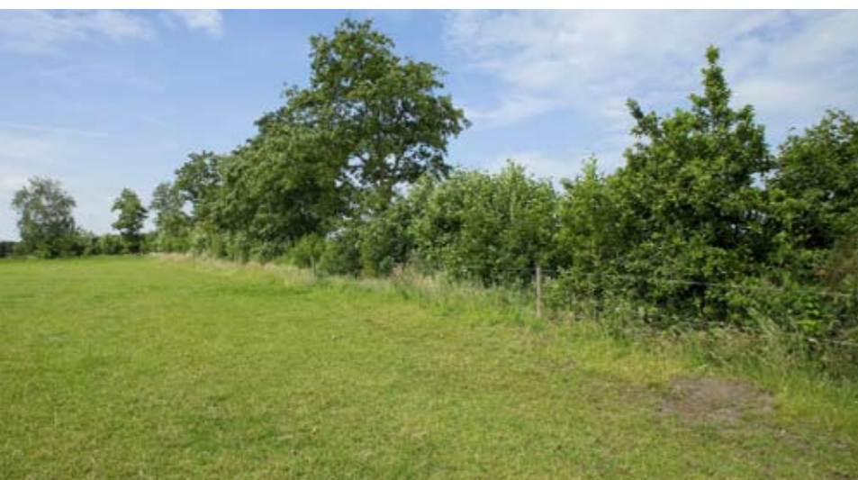
Boomsingel achter het huis die door Mous flink is uitgedund met behulp van SBNL. Het lint is nodig omdat de singel niet dicht genoeg is om als veekering dienst te doen.

Meer over paarden en landschapsinrichting via www.tuinenlandschap.nl