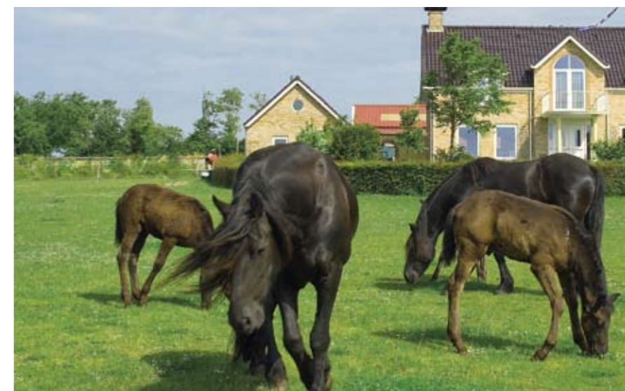
De rijbak links van het huis wordt gecamoufleerd door een aarden wal en Carpinus betulus .